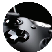
VídeoJogos e Aplicações

"Passion is not what you're good at. It's what you enjoy the most."